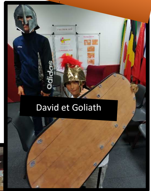
David et Goliath

Dieu regarde au cœur et non aux apparences 1 Sam 16 : 7