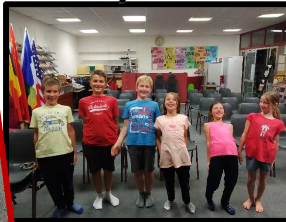
Les CRU'ZOES 1,2,3,4,5,6 !